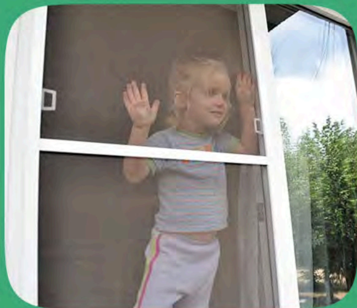
МОСКИТНЫЕ СЕТКИ (45 случаев)