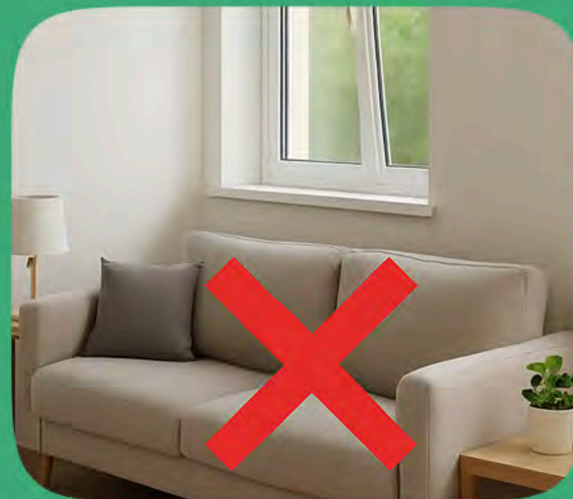
ПОДОКОННИК (20 случаев)