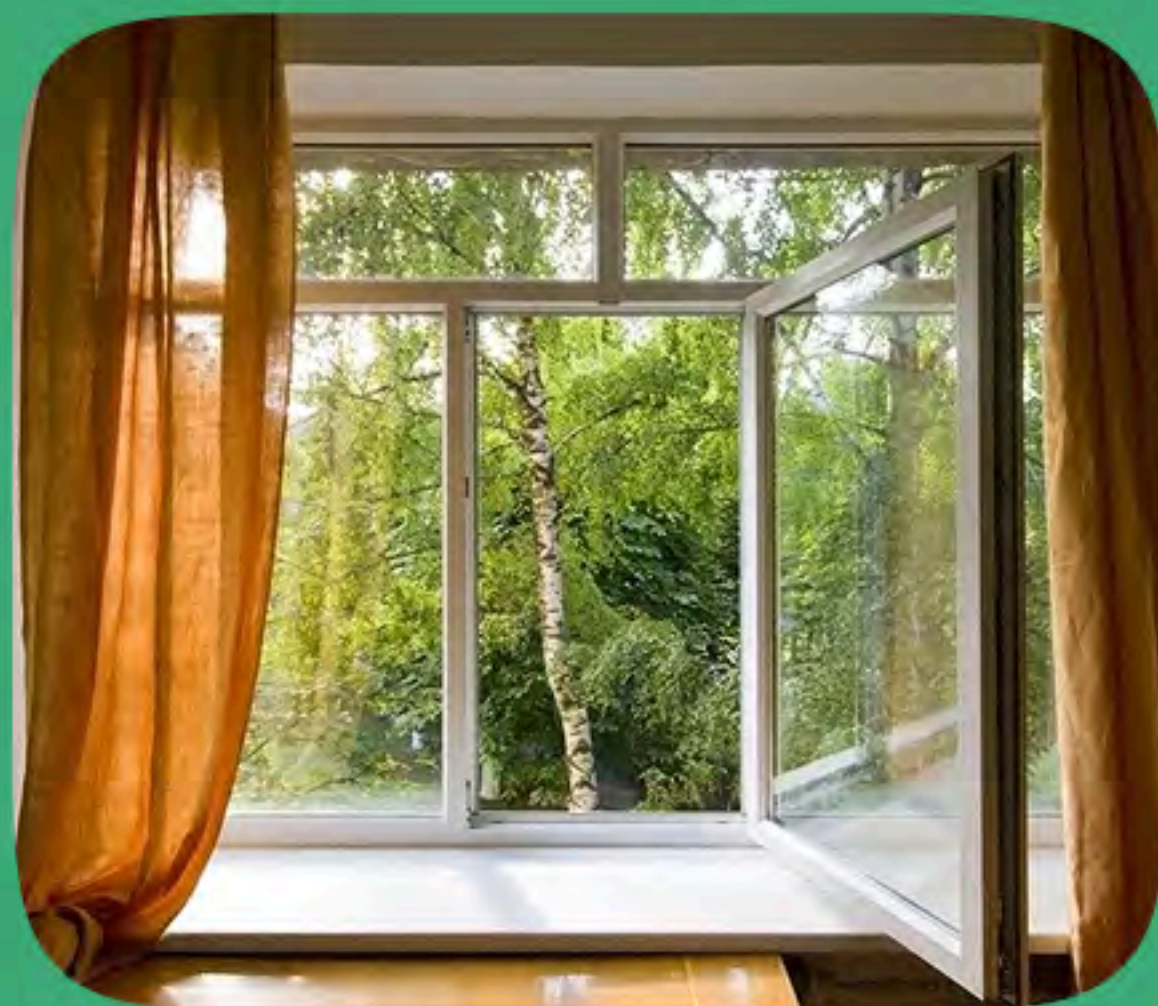
ОТКРЫТЫЕ ОКНА (30 случаев)