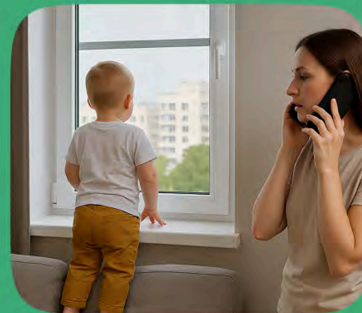
БЕЗ ПРИСМОТРА (5 случаев)